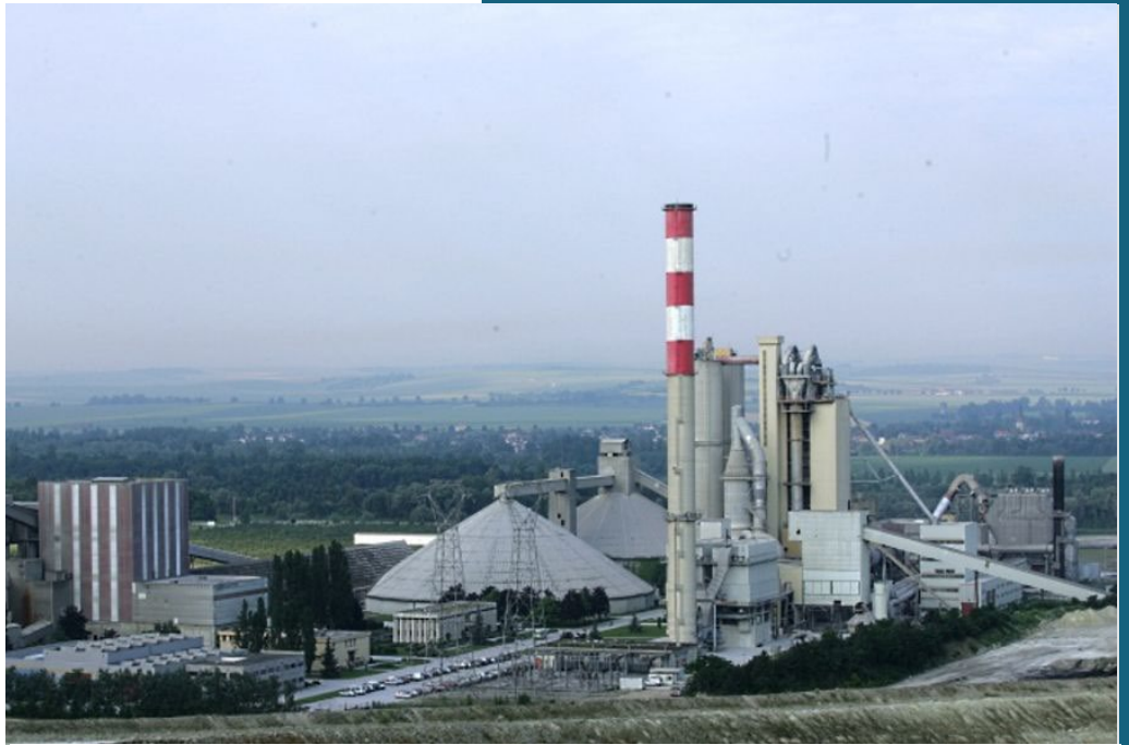
Usine de Couvrot